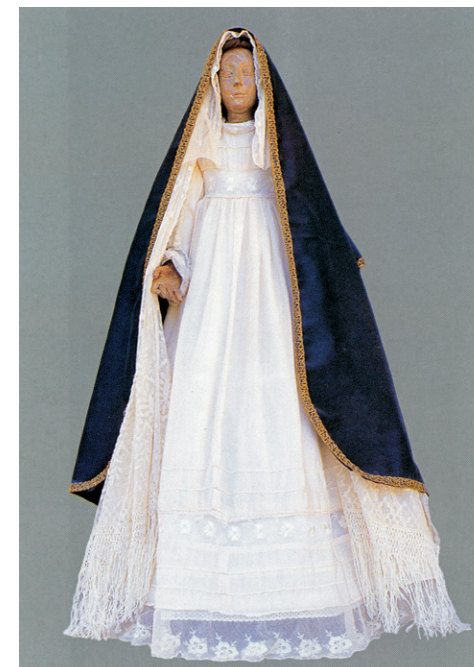
Santa María de la Cabeza.