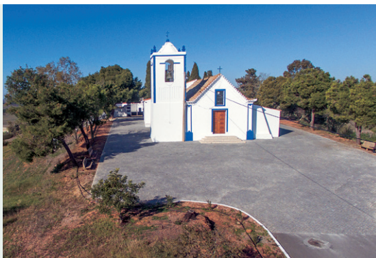
1. Perspectiva general de la iglesia y de la aldea.