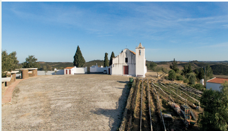
1. Perspectiva general de la iglesia y de la aldea.

< Cronología > Fundación: Aproximadamente entre 1515-1530 | Reconstrucción – remodelaciones: siglos XVII, XVIII, XIX, XX.