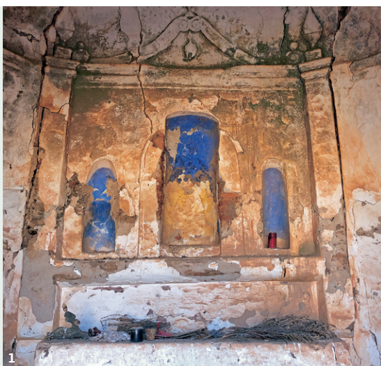
1. Perspectiva general de la capilla mayor.

< Cronología > Fundación: siglos XIV-XV | Reconstrucción – remodelación: siglo XVII | Abandono: siglo XX.