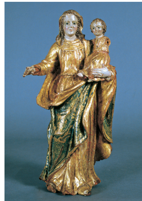
Nuestra Señora de la Concepción de Alcaria Ruiva.