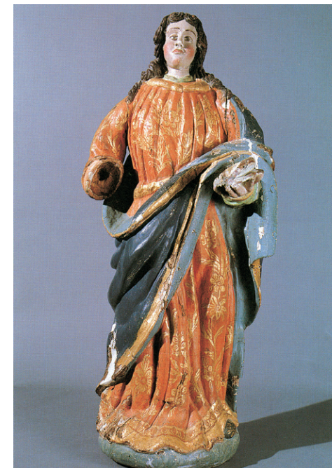
Nuestra Señora de los Remedios de Alcaria Ruiva.